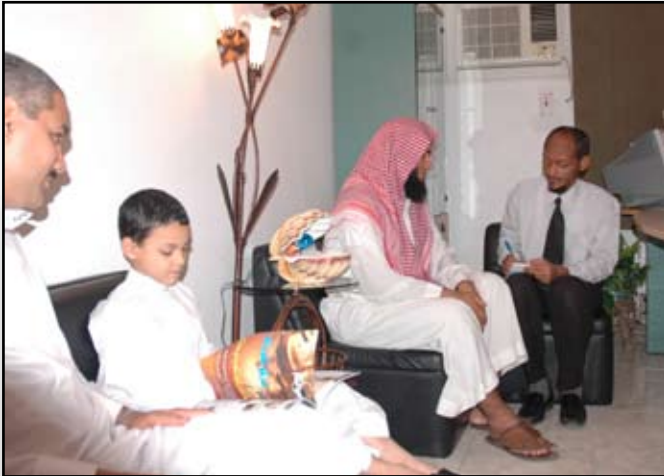
المرح أثناء استماعه للأستاذ شوقي

ماما أولاً لأن الرسول صلى الله عليه وسلم عندما سأله أحد