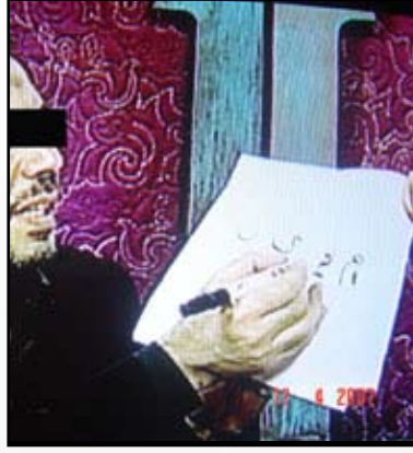
تمائم وأكاذيب على الهواء

المشرف العام على شبكة نور الإسلام الدكتور محمد بن عبد الله الهبدان قال: لقد ظهرت ثلاث قنوات - قناة شهر زاد، وقناة كنوز، وقناة جرس - والرابعة في الطريق وبدأت في بث برامج يقوم عليها بعض العرافين والكهان والسحرة الذين يجاهرون بادعاء علم الغيب والاستعانة بالشياطين.. وكل ذلك يصب في بيوت المسلمين . وقد تفاعل معهم الكثير من جهال الناس وخصوصاً أهل الخليج ( والنساء خاصة ) وصاروا يشتكون أحوالهم المادية والاجتماعية والنفسية .. فماذا بقي لله!؟ لقد لبس هؤلاء السحرة على الناس أمر دينهم فهم يدعون حب الله وحب رسوله صلى الله عليه وسلم ويقولون إن السحر حرام وهم يفعلونه عياناً ويكتبون الطلاسم والحجب أمام الأَشْهاد . ويطلبون مبالغ خيالية نظير هذا