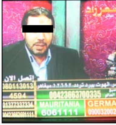
المشعوذ يتلقى أحد الإتصالات

بالعقيدة الصحيحة والتوحيد الخالص حتى لا يقع في فخ هؤلاء الدجالين والسحرة .