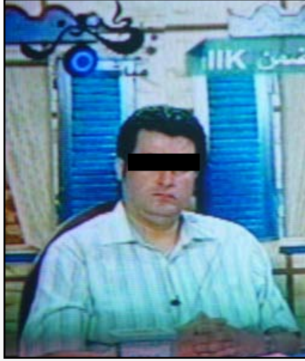
أحد الدجالين على قناة كنوز

إفراغها بطرق دجلية فاضحة بالإضافة لوجود مجموعة من الناس المساكين المستعدين لدفع أموال طائلة مقابل تعرضهم لضغوط نفسية وعصبية تجلبهم يلجأون لهؤلاء الدجالين رغبة في التخلص من لأوجاعهم وأوهامهم في ظل قلة الإيمان والفرغ الروحي ومحاربة هذه الظاهرة لابد من تطبيق ثلاثة أمور أولها بيان خطر هؤلاء المشعوذين والدجالين على الفرد والمجتمع وبيان كذبهم وافتراءهم وبعدهم عن الحقائق والأمر الثاني إقامة حملات لتقوية الوازع الديني والعقلاني لدى عامة الناس ، ويمثل العلاج الثالث محاولة إيقاف مثل هذه القنوات أو إلغائها إن أمكننا ذلك رغم صعوبة هذا الموضوع فمسألة الرقابة في الفضائيات اليوم مختفية وتبقى على الفرد مسؤولية تبنيه الرقابة الذاتية له في عقله وضميره .