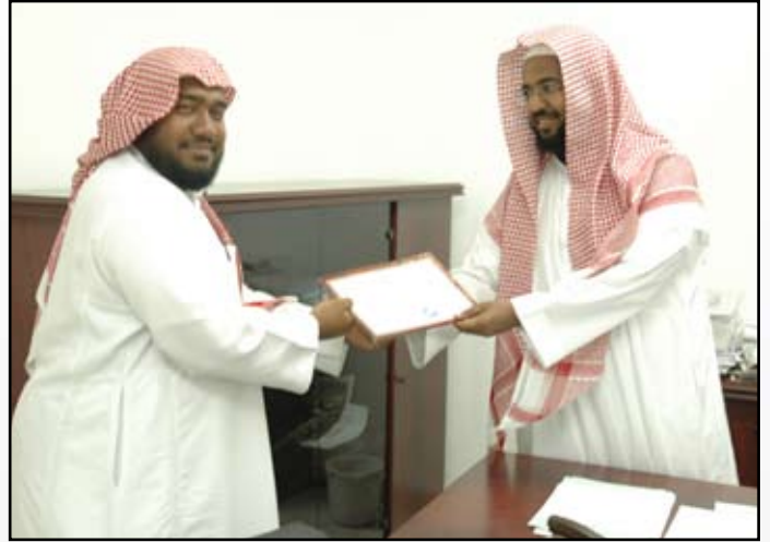
القطبي أثناء تسلمه شهادة تفوق من قطاع الوسط

* كلمة نختم بها هذا الحوار الشيق؟ أسأل الله الكريم أن يديم علينا وعلى منسوبي جمعيتنا المباركة وعلى المسلمين جميعاً في مشارق الأرض ومغاربها نعمة الصحة والعافية والأمن والأمان.